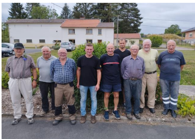
Nos vétérans lors des préparatifs.

Un grand merci également aux membres de l'amicale (surtout nos vétérans) et leurs conjoints (-es) toujours au pied levé pour la préparation de ce week-end.