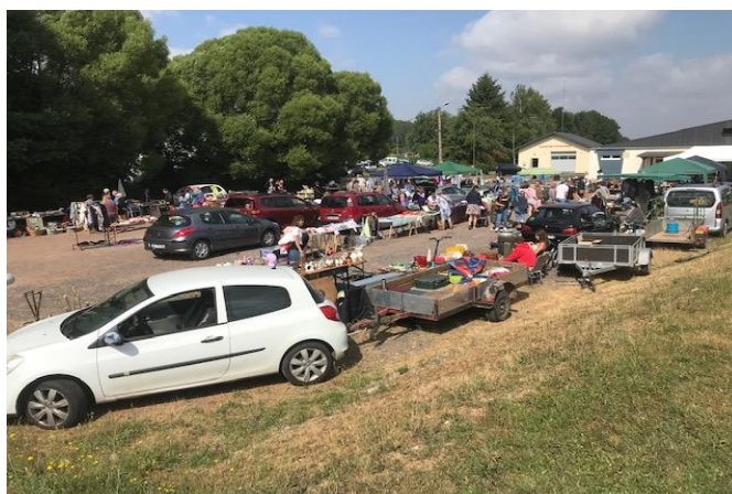
Le vide grenier du dimanche 2 juillet.

Chef de l'unité opérationnelle A/C JEDAR Stéphane