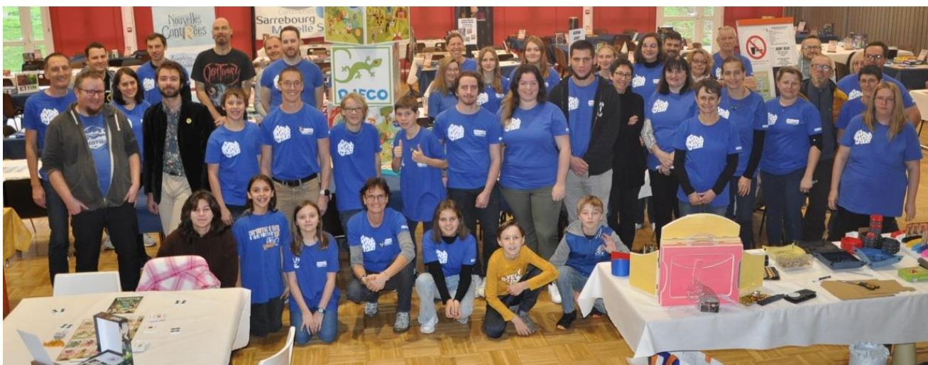
Une partie des 60 bénévoles du salon du jeu de Voyer

Ce sont plusieurs centaines de joueurs qui ont défilé le temps d'un week-end à la salle polyvalente de Voyer. Des curieux, des novices, des familles entières et des joueurs invétérés ont pu profiter de l'animation proposée par plus de 60 bénévoles que nous ne remercierons jamais assez. Ils ont pu jouer à près de 100 jeux de société dont la plupart sont sortis cette année. Les Nancéens, Messins, Spinaliens ou autres Strasbourgeois n'ont pas regretté d'être venu d'aussi loin. Ils ont pu jouer avec des auteurs de jeux réputés et par la même occasion se faire dédicacer leur jeu. Cette 3 ème édition a pu bénéficier du soutien financier de la Communauté de Communes de Sarrebourg Moselle Sud.