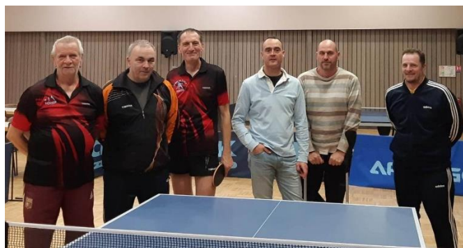
Une partie de l'équipe de tennis de table qui accueillait l'équipe de Hesse-Imling lors de la 6 ème journée