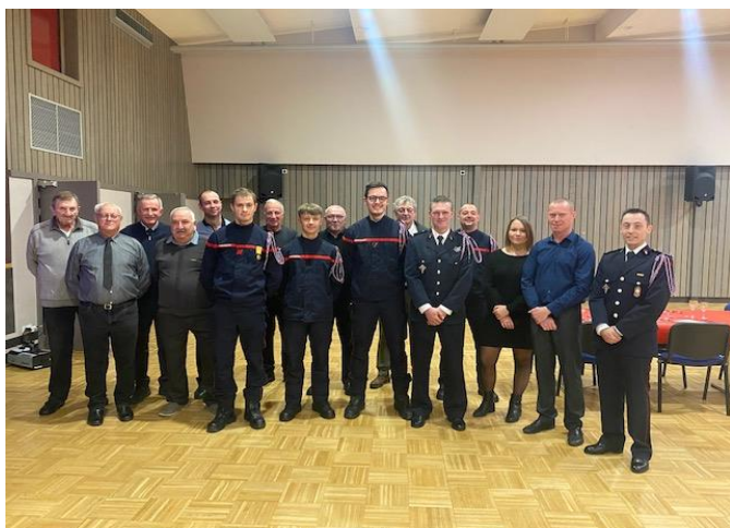
L'unité opérationnelle ainsi que son amicale lors de notre dernière Ste Barbe.

L'amicale des sapeurs-pompiers de Voyer vous remercie de votre confiance et de votre soutien apporté lors de nos manifestations, ainsi que de votre générosité lors de notre passage pour les calendriers.