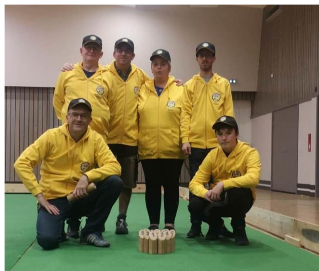
L'équipe 1 des Gagottes avec sa nouvelle tenue

Voyer termine 4 ème du championnat de Lorraine derrière Boulay, Metz et Pagny malgré leur victoire dernièrement à Bazoncourt 46 à 37. Le championnat reprendra à Voyer le 28 janvier avec la réception de l'équipe des Art'Quilleurs de Behonne. A noter l'inscription de 2 équipes de plus et la participation prochainement pour la première fois aux Interclubs.